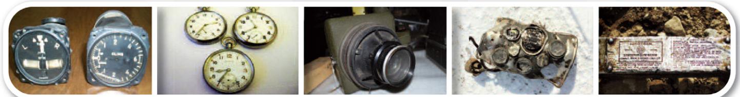
Cadrans contenant un composé lumineux au radium