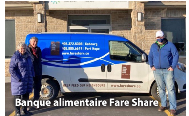
Banque alimentaire Fare Share