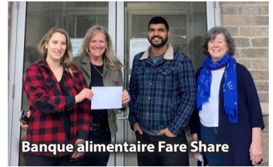
Banque alimentaire Fare Share