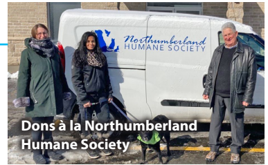
Dons à la Northumberland Humane Society

En faisant des gestes concrets pour améliorer le bien-être au sein de notre collectivité, nous grandissons aussi bien en tant que personnes qu'en tant qu'entreprise.