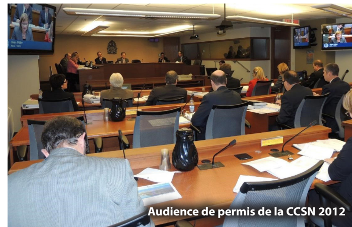
Audience de permis de la CCSN 2012

Tout le monde peut intervenir lors de l'audience de la CCSN, soit par écrit, soit en soumettant une intervention écrite puis en la présentant verbalement pendant l'audience. La