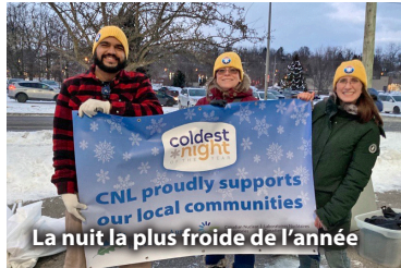
La nuit la plus froide de l'année